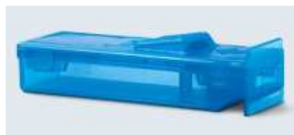
Blade Remover Mini Feather

Il FEATHER® Blade Remover è un dispositivo in polipropilene per la rapida e semplice rimozione delle lame chirurgiche monouso di qualsiasi tipo e dimensione di manico di bisturi. Evita il diretto contatto con le lame garantendo maggiore igiene e sicurezza ed è utilizzabile per ogni tipo di lame e di manici.