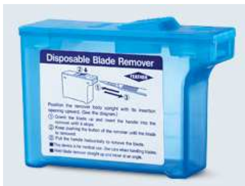
Blade Remover Feather